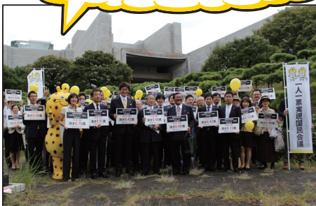
▲弁論期日前、集合写真